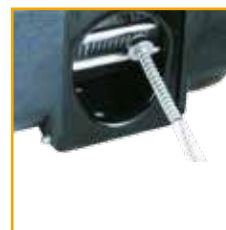
EINLAUFSPERRE MIT DÄMPFUNGSFEDER