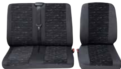
Einzelstz + Doppelsitz