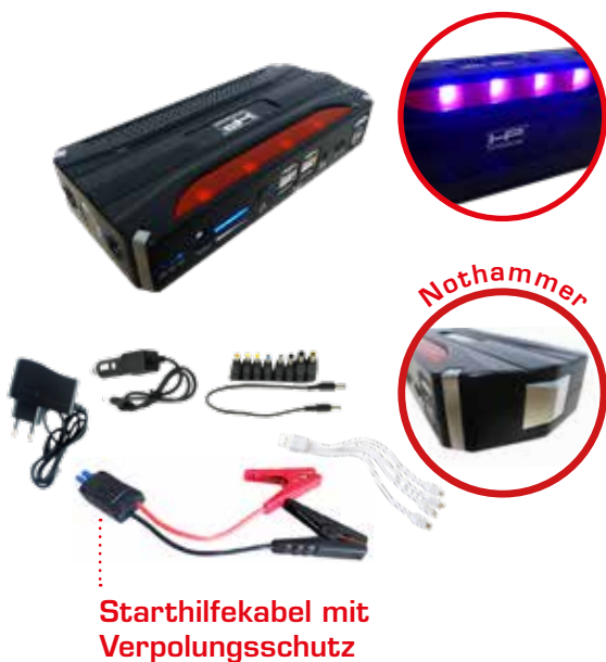
Starthilfekabel mit Verpolungsschutz