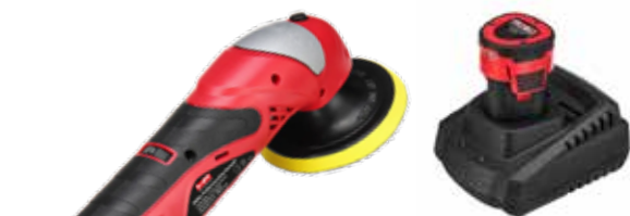
Polierteller mit Klettbefestigung