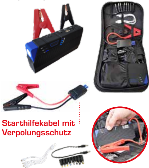
Starthilfekabel mit Verpolungsschutz