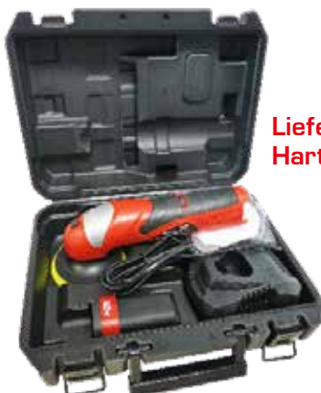
Lieferung im Hartschalenkoffer